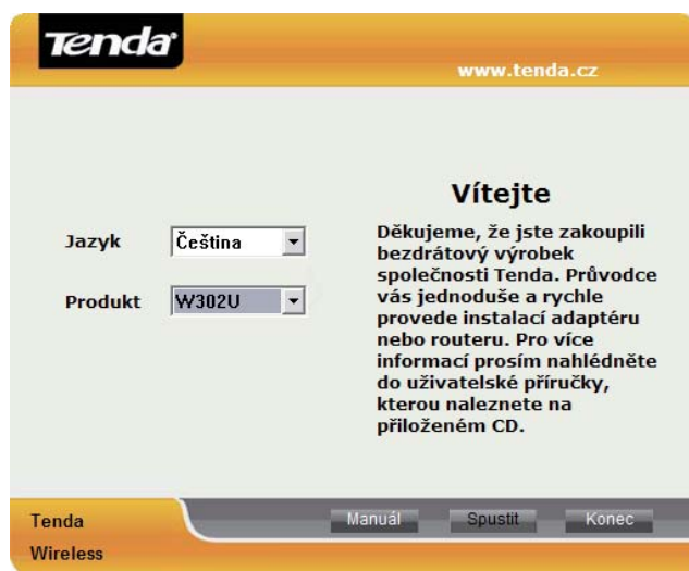
Obr. 1.2 – Uvítací obrazovka