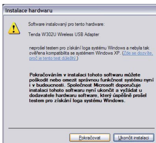
Obr. 1.4 – Potvrzení instalace