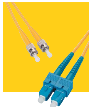
Patch kabel SC/ST

„L“ v objednací čísle nahrazuje požadovanou délku: 1 = 1 m, 2 = 2 m, 3 = 3 m, 5 = 5 m. Ostatní délky nebo konektory a simplexní kabely jsou dostupné na objednávku