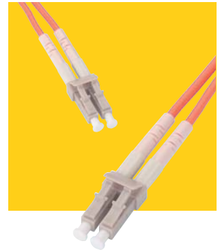
Patch kabel LC/LC