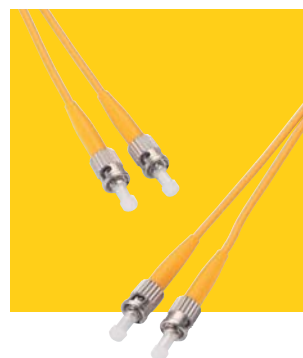
Patch kabel ST/ST