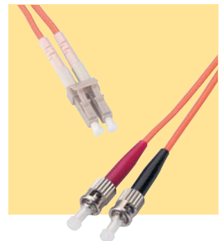
Patch kabel LC/ST